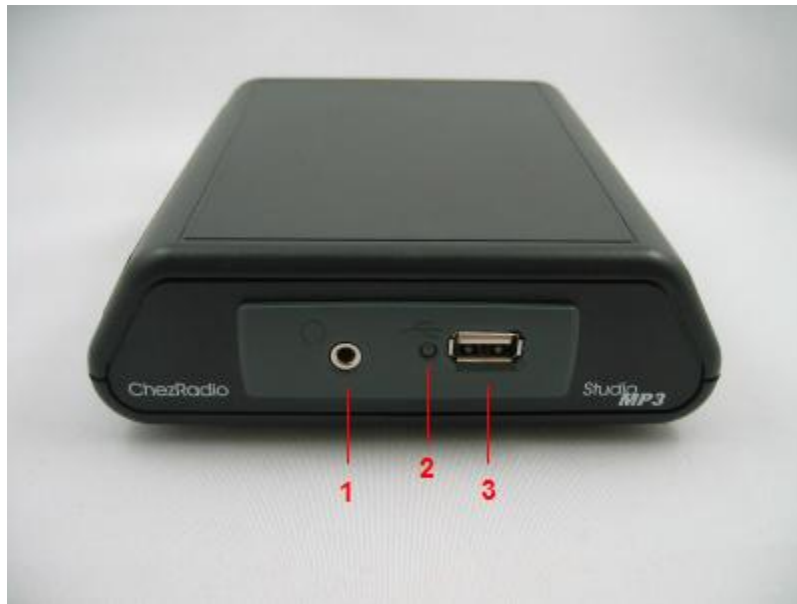
Fig. 1 - frente StudioMP3 vista